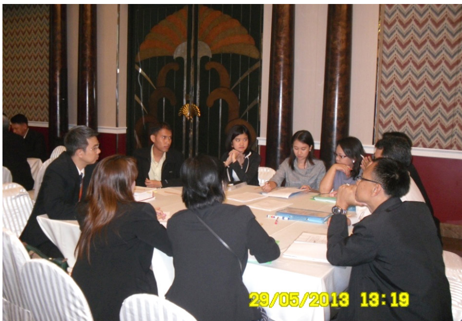
การประชุมกลุ่มย่อยระดมความคิด (Workshop Brainstorming)