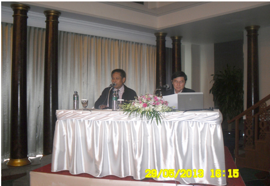
การนำเสนอผลการประชุมกลุ่มย่อย (Presentation)