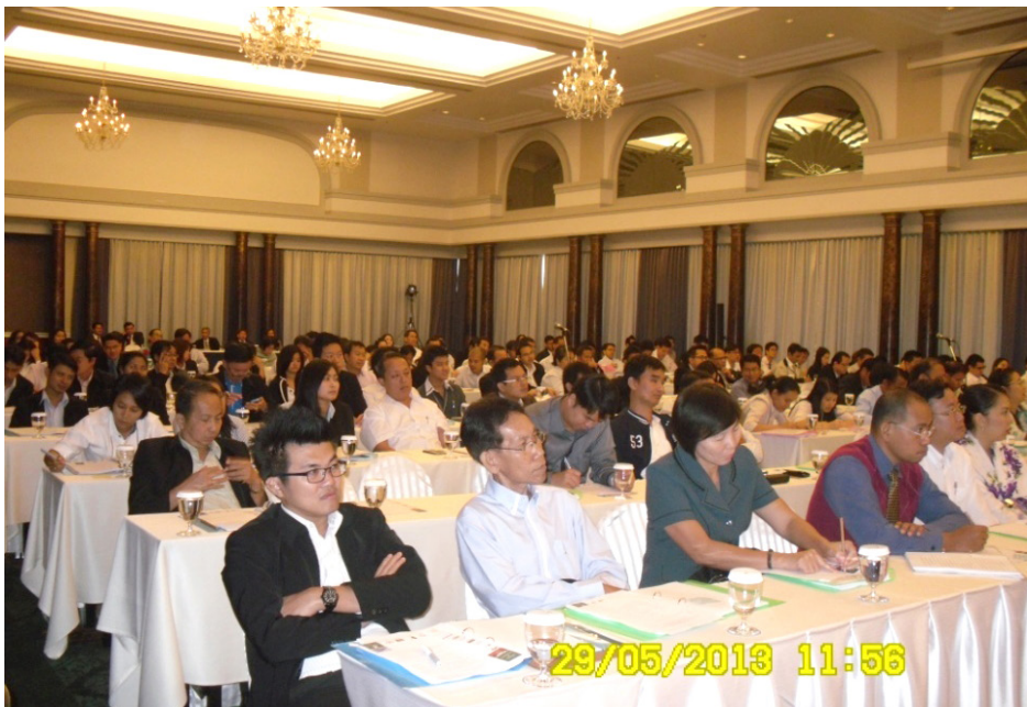
ผู้เข้าร่วมประชุมเชิงปฏิบัติการรับฟังคำบรรยายจากวิทยากรผู้ทรงคุณวุฒิ