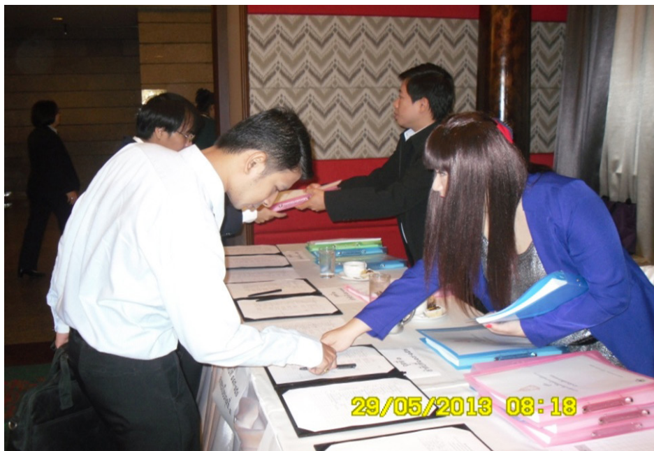
ผู้เข้าร่วมประชุมเชิงปฏิบัติการลงทะเบียน