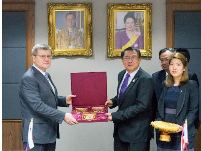
ที่มาของภาพ ๓.๑-๓.๒

https://www.facebook.com/RussianInThai/photos/pb.100068809406387.-2207520000./568529869998209/?type=3